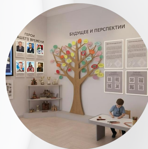
Зона "Будущее и перспективы"