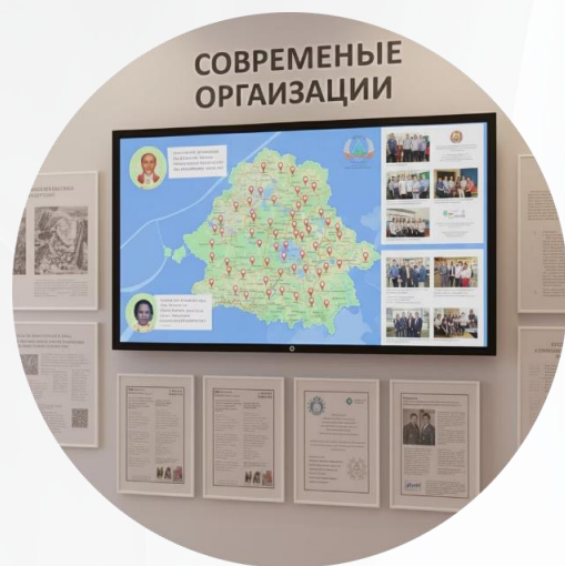
Зона "Современные организации"