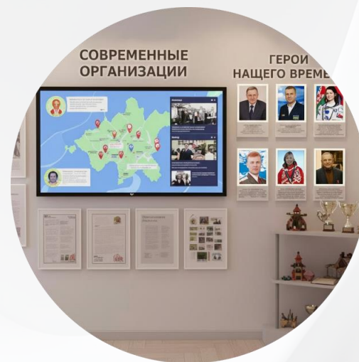
Зона "Герои нашего времени"