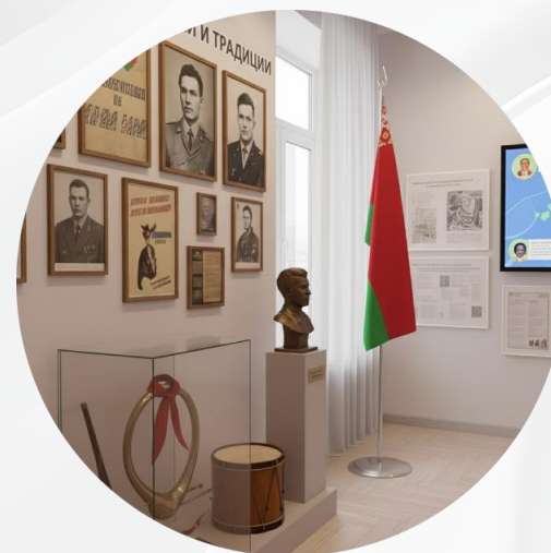
Зона "Истоки и традиции"